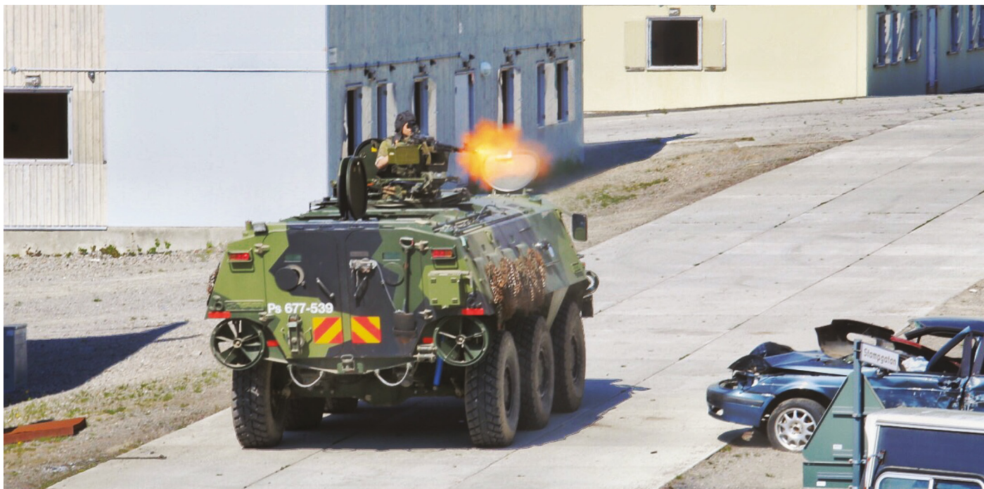
Puolustusvoimien panssaroitu miehistönkuljetusajoneuvo, eli Pasi.