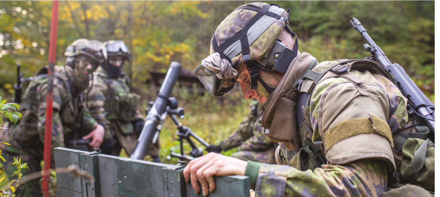
Uudenmaan jääkäripataljoonasta löytyy Kaartin jääkäriyksen tulivoimaisimmat aseet.