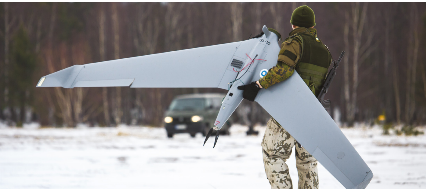
Esikunta- ja viestikompaniassa koulutetaan varusmiehiä tiedustelulennokkien käyttöön.